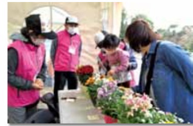
ガイドボランティア2021

❖ 国際園芸博覧会の機運醸成に向け、ガーデンネックレス横浜ガイドボランティアの育成を開始 ❖ よこはま緑の推進団体、推進リーダー及び市民ボランティアの方々と連携し、新たに「国際園芸博覧会応援花壇」を設置し、管理を開始 ❖ 金沢動物園開園40周年