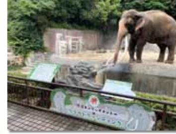
クラウドファンディングにより設置したゾウの自動給水装置

❖ よこはま動物園ズーラシアでクラウドファンディングによりミナミアフリカオットセイの日よけ等を設置