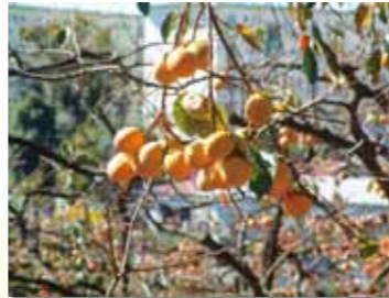
95品種を超える全国一のカキコレクション

❖ 「公益財団法人横浜市緑の協会SDGs達成に向けた取組2021-2030」を策定 ❖ 横浜市SDGs認証制度Y-SDGsにおいて「上位：Superior」の認証、横浜市健康経営認証において「クラスAA」の認証を受ける ❖ 野毛山動物園開園70周年