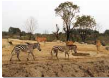
▲肉食動物と草食動物の4種混合展示