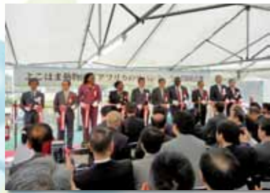
「アフリカのサバンナ」全面開園式典の様式