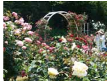
370株(当時)のバラが咲き誇る庄巻の風景