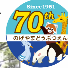
クラウドファンディングにより改修したレッサーパンダの展示場

❖ 国際園芸博覧会の機運醸成に向け、ガーデンネックレス横浜ガイドボランティアの育成を開始 ❖ よこはま緑の推進団体、推進リーダー及び市民ボランティアの方々と連携し、新たに「国際園芸博覧会応援花壇」を設置し、管理を開始 ❖ 金沢動物園開園40周年