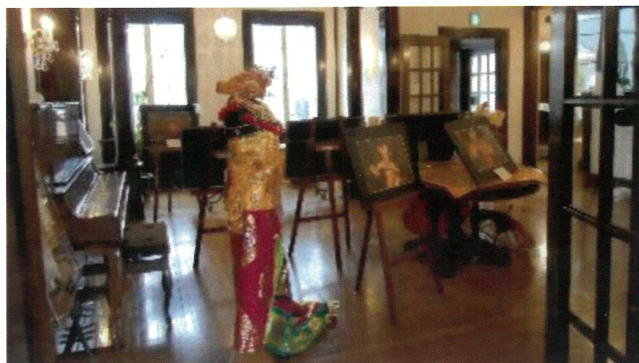
(令和5年度 横浜山手芸術祭)